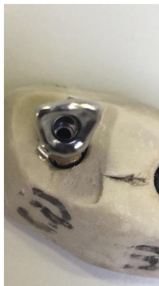
imagen 3: resultado hta 33.690.754.01-2