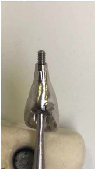
imagen 3: resultado hta 33.690.754.01-2